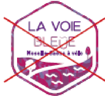
~~~~ Changer les couleurs