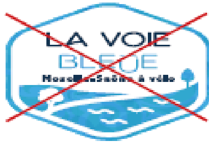
~~~~ Déformer la logotype