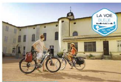
Logotype sur fonds clairs

Ce logotype a été conçu de façon à être utilisé sur tout type de support de manière visible.