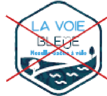
~~~~ Inverser les couleurs