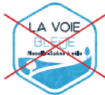
~~~~ Supprimer les éléments graphiques