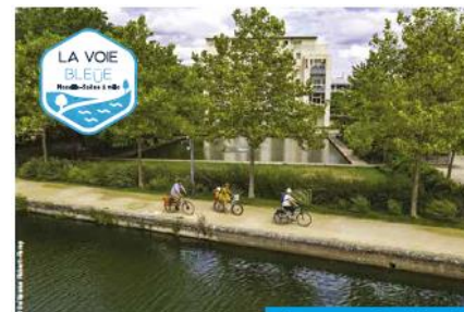
Logotype sur fonds foncés