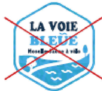
~~~~ Changer les typographies