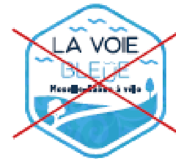
~~~~ Déplacer les éléments graphiques